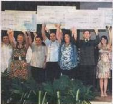
Semifinalistas del concurso de las PYMES.

Según los organizadores del concurso, el dinero que obtuvieron las empresas debe ser invertido en el crecimiento