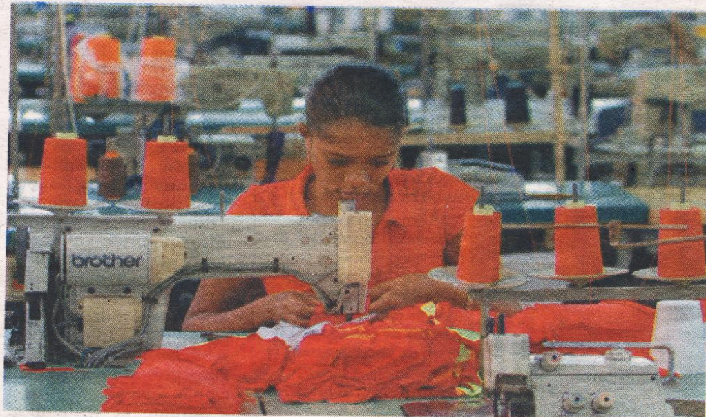
Empleos. Es necesaria la generación de empleos en las pequeñas y medianas empresas.

nominado 'Red de Oportunidades' son buenos, pero no eficientes porque crean dependencias para salir del círculo de falta de recursos, lo que se necesita son programas que involucren a los empresarios", enfatizó Antinori.