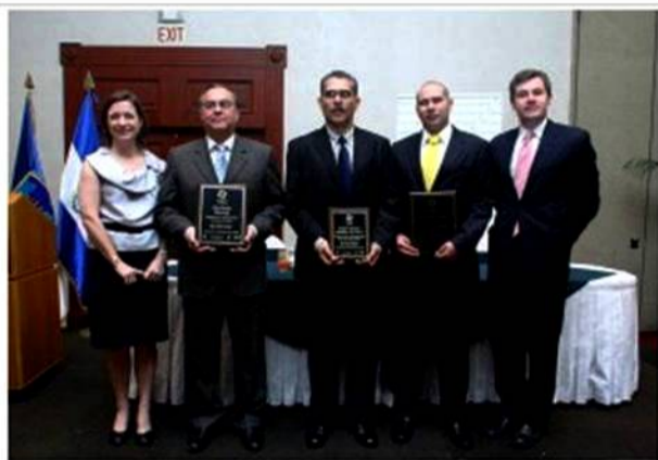
Ganadores en El Salvador.

Diez ganadores y siete menciones de honor fueron seleccionados en Centroamérica por Pioneros de la Prosperidad , un programa global para empresas emprendedoras que incluye competencias en el Caribe, África y América Central.